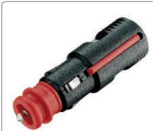
■ US 12/24-8 A Bestell-Nr.: 3 6771 1000