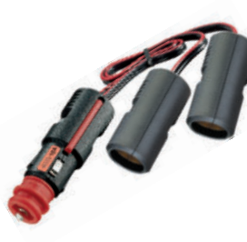
■ ZKPZ 12/24 Bestell-Nr.: 3 6787 9000

Verlängerungskabel 2 x 0,75 mm 2 mit Sicherheits-Universalstecker, 8 A Sicherung und Kupplung. Kabellänge 4 m.