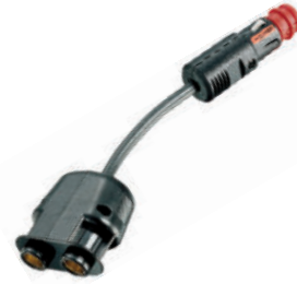
■ ZKP 12/24 Bestell-Nr.: 3 6765 2000

Dreifach-Aufbausteckdose für Universalstecker, max. 16 A/ 6-24 V. Anschluss mit Flachsteckern 6,3 mm Abmessungen L 85 x B 99 x H 33 mm