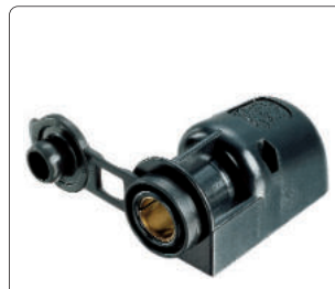
■ ASD 12/24 Bestell-Nr.: 3 5760 8002

Normstecker mit Schraubanschluss, 6-24 V, passend für alle 12/24 V Normsteckdosen, Strombelastbarkeit max. 15 A.