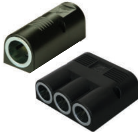
■ AZD 12/24 Bestell-Nr.: 3 6760 4000

Einbausteckdose mit Deckel für Stecker \varnothing 21 mm. Einbauloch- \varnothing 28 mm.