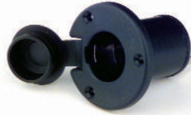
■ ESD 12V rund Bestell-Nr.: 7 0002 1216

Einbausteckdose analog zu Zigarettenanzünder mit Deckel und rechteckigem Befestigungsflansch. Erforderliches Einbauloch \varnothing 28 mm. Passend für Stecker \varnothing 21 mm. Anschluss mit Flachsteckern 6,3 mm. Strombelastbarkeit 16 A. Abmessungen L 57 x B 33 x T 48 mm