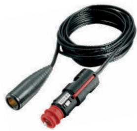
■ VK 12/24 Bestell-Nr.: 3 6781 4000

Verlängerungskabel 2 x 0,75 mm 2 mit Sicherheits-Universalstecker und 8 A Sicherung. Kupplung mit Innen- \varnothing 21 mm (Zigarettenanzünder), 6-24 V. Ausziehbares Spiralkabel von 0,6 - 3 m.