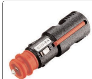
■ SUS 12/24-8 A Bestell-Nr.: 3 6771 2000

Universalstecker mit integrierter Leuchtdiode und Zugentlastung. Passend für Zigarettenanzünder und Normsteckdosen. 6-24 V.