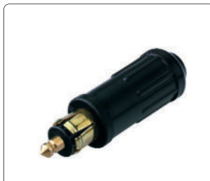
■ NS 12/24 -15 Bestell-Nr.: 3 5300 5001

Universal-Winkelstecker mit Funktionskontrolle mittels Leuchtdiode und integrierter Sicherung. Die festarretierbare Ausgleichhülse durch Bajonettverrastung gewährt einen sicheren Halt. 7,5 A / 6-24 V bis maximal 1,5mm 2 Kabelquerschnitt.