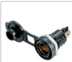
■ ESD 12/24 Bestell-Nr.: 3 5760 7002

Einbau-Normsteckdose mit Deckel zum Schutz vor Staub und Spritzwasser. Passend für Norm- und Universalstecker, max. 16 A/6-24 V. Einbauloch- \phi 18 mm, Gewindelänge 8 mm. Anschluss mit Flachsteckern 6,3 mm.