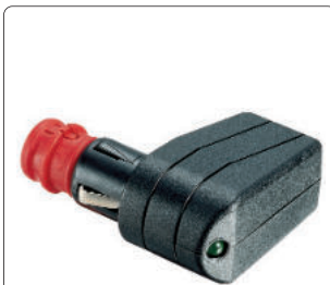
■ UWS 12/24-8A Bestell-Nr.: 3 5773 0000

Winkelbarer Universalstecker mit integrierter Sicherung 8 A. Die festarretierbare Ausgleichhülse durch Bajonettverrastung gewährt einen sicheren Halt. 6-24 V, bis maximal 1,5 mm 2 Kabelquerschnitt.