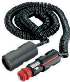
■ WVK 12/24 Bestell-Nr.: 3 6781 8100

Adapterkabel von Normstecker auf Kupplung mit Innen- \varnothing 21 mm (Zigarettenanzünder), 6-24 V, max. 8 A. Flachkabel 2 x 0,75 mm 2 , Länge 0,25 m.