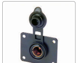
■ ESD 12/24 MP Bestell-Nr.: 0 8000 0401

Aufbau-Steckdose mit Deckel. Passend für Norm- und Universalstecker, max. 16 A/6-24 V. Anschluss mit Flachsteckern 6,3 mm.