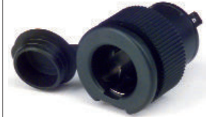
■ ESD 12V gewinde Bestell-Nr.: 7 0002 1218 ■ ESD 24V gewinde Bestell-Nr.: 7 0002 1824

Einbausteckdose analog zu Zigarettenanzünder mit Deckel und rundem Befestigungsflansch. Erforderliches Einbauloch \varnothing 28 mm. Passend für Stecker \varnothing 21 mm. Anschluss mit Flachsteckern 6,3 mm. Strombelastbarkeit 16 A. Abmessungen \varnothing 46 x T 48 mm