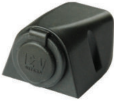
■ AZS 12V Bestell-Nr.: 7 0002 1212 ■ AZS 24V Bestell-Nr.: 7 0002 1224

Aufbausteckdose mit Deckel für Zigarettenanzünderstecker und formschönem Befestigungsflansch. Passend für Stecker \varnothing 21 mm. Anschluss mit Flachsteckern 6,3 mm. Strombelastbarkeit 16 A. Bohrlochabstand 44 mm. Abmessungen L 81 x B 55 x H 41 mm