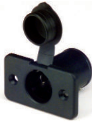
■ ESD 12 V eckig Bestell-Nr.: 7 0002 1206

Aufbausteckdose mit Deckel für Zigarettenanzünderstecker und formschönem Befestigungsflansch. Passend für Stecker \varnothing 21 mm. Anschluss mit Flachsteckern 6,3 mm. Strombelastbarkeit 16 A. Bohrlochabstand 44 mm. Abmessungen L 81 x B 55 x H 41 mm