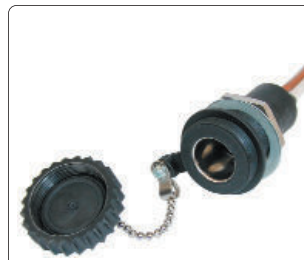
■ WSD 12/24 Bestell-Nr.: 3 5200 5000

Einbau-Dreifach-Normsteckdose. Passend für Norm- und Universalstecker. Maximale Gesamtstromaufnahme aller drei Steckdosen 16 A/6-24 V. Anschluss mit Flachsteckern 6,3 mm.