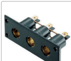
■ DSD 12/24 Bestell-Nr.: 3 5761 2002

Einbau-Normsteckdose mit Deckel zum Schutz vor Staub und Spritzwasser. Passend für Norm- und Universalstecker, max. 16 A/6-24 V. Einbauloch- \phi 18 mm, Gewindelänge 8 mm. Anschluss mit Flachsteckern 6,3 mm.