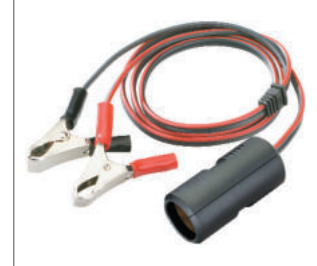
■ KPB 12/24 Bestell-Nr.: 3 6787 4000

Zwillingskupplung für Einbausteckdose analog zu Zigarettenanzünder. 2 Kupplungen mit Innen- \varnothing 21 mm, 6-24 V, max. 2 x 5 A. Integrierte Sicherung 10 A. Flachkabel 2 x 0,75 mm 2 , Länge 0,25 m.