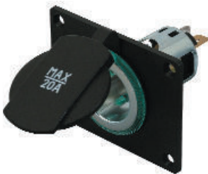
■ PSD 12/24 MP Bestell-Nr.: 3 6804 1000

Einbausteckdose analog zu Zigarettenanzünder mit Deckel. Einlochmontage \varnothing 30 mm mit Kontermutter, Gewindelänge 13 mm. Passend für Stecker \varnothing 21 mm. Anschluss mit Flachsteckern 6,3 mm. Strombelastbarkeit 16 A. Abmessungen \varnothing 36 x T 48 mm