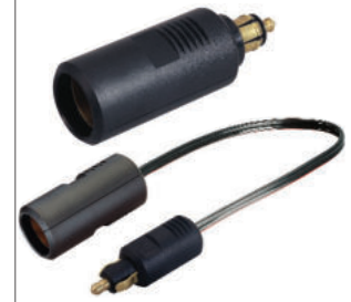
■ NSA 12/24 Bestell-Nr.: 3 6787 2900

Zwillingskupplung mit zwei Normsteckdosen und Sicherheits-Universalstecker mit 16 A-Sicherung zum Anschluss von zwei Elektrogeräten. Passend für Norm- und Universalstecker, max. 16 A/6-24 V, Länge 0,2 m.