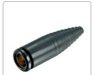
■ KP 12/24 Bestell-Nr.: 3 5762 0000

Wasserdichte Einbau-Normsteckdose mit Schraubdeckel. IP 67. Passend für Norm- und Universalstecker, max. 16 A / 6-24 V. Einbauloch- \phi 18 mm, Gewindelänge 10 mm. Konfektioniert mit vergossenen 30 cm langen Anschlussleitungen.