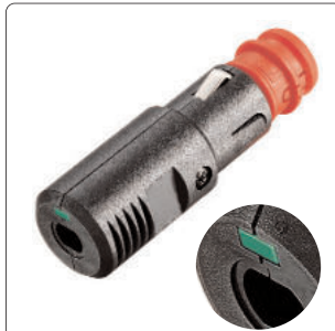
■ USL 12/24-8 A Bestell-Nr.: 3 6771 1100

Universalstecker mit Schraubanschluss und Zugentlastung. Passend für Zigarettenanzünder und Normsteckdosen. 6-24 V. Ausführung in 8 A oder 16 A