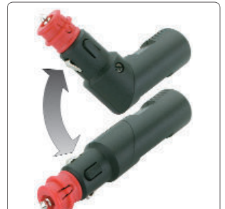
■ SWS 12/24-8 A Bestell-Nr.: 3 6774 2000

Universalstecker mit integrierter Sicherung 8 A mit Schraubanschluss, und Zugentlastung. Passend für Zigarettenanzünder und Normsteckdosen. 6-24 V.