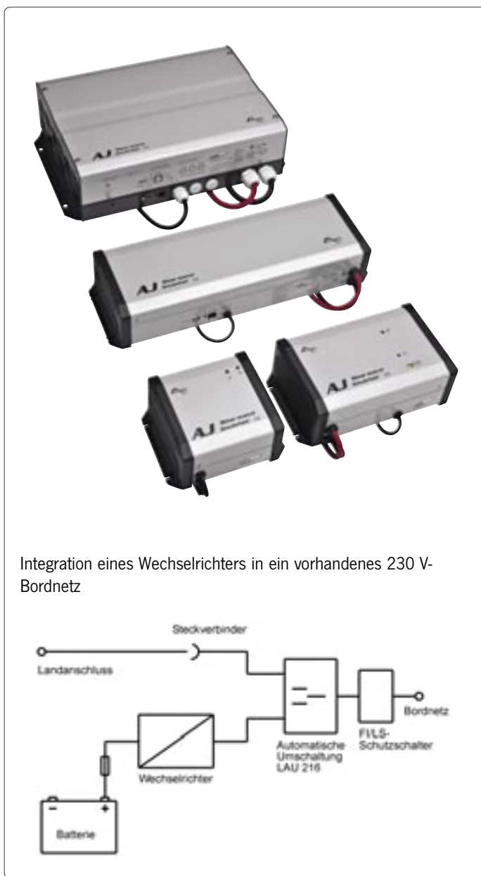
Integration eines Wechselrichters in ein vorhandenes 230 V-Bordnetz

für AJ 1000, AJ 2100 zum Fern-ein- und -ausschalten des Wechselrichters. Optische und akustische Zustandsanzeige. Ein Verbindungskabel (5 m) ist im Lieferumfang enthalten. B 105 x H 52,5 mm.