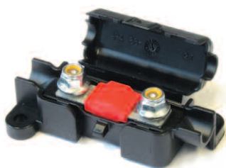
SHM 1 Référence: 6 5631 0001

Porte-fusible de la série STM accepte des sections de câble jusqu'à 10 mm 2 . Vis de fixation M5