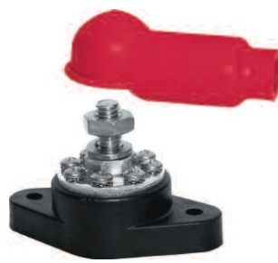
■ SSP 1/8 Bestell-Nr.: 7 0010 2103

Sammelstützpunkt mit 8 zusätzl. Abgängen. Sockel mit Gewindebolzen \varnothing 9,5 mm. Zur Befestigung sind 2 Bohrungen \varnothing 6,3 mm im Sockel angebracht. Incl. Abdeckkappe, max. 150A.