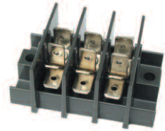
■ FSB 3 Bestell-Nr.: 6 1388 6033

Aufschraubbarer Flachsteckblock. für Flachstecker 6,3 mm. 3 getrennte Potentiale mit je 4 Steckmöglichkeiten. Max. 25A.