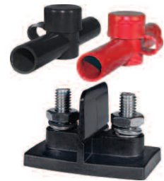
■ SSP 2 Bestell-Nr.: 7 0010 2017

Zweipoliger Sammelstützpunkt. Sockel mit Gewindebolzen \varnothing 9,5 mm. Zur Befestigung sind 2 Bohrungen \varnothing 6,3 mm im Sockel integriert. Die Abdeckkappen sind im Lieferumfang enthalten.