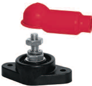
■ SSP 1 Bestell-Nr.: 7 0010 2003

Sammelstützpunkt. Sockel mit Gewindebolzen \varnothing 9,5 mm. Zur Befestigung sind 2 Bohrungen \varnothing 6,3 mm im Sockel angebracht. Abdeckkappe ist im Lieferumfang enthalten.