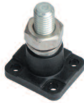
■ EKS Bestell-Nr.: 6 1690 0147