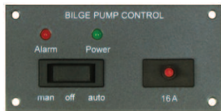
BPA 202 Bestell-Nr.: 0 2800 2032

Bilgenpumpen-Kontrollpanel zum wahlweisen Schalten der Bilgenpumpe über einen Schwimmerschalter oder manuelles Einschalten. Schalterstellungen „Manuell-Aus-Automatik“, mit 2 Leuchtdiodenanzeigen für Betrieb und Alarm. Absicherung über integrierten thermischen Schutzschalter.