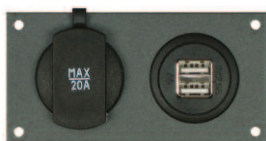
MPE 202 Bestell-Nr.: 0 2800 2020

Abmessungen B 315 x H 210 x T 70 mm Hierzu empfohlene Reihenklammern Type RKL 16/4