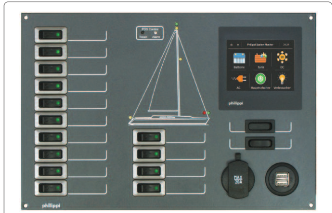
STV 256 Bestell-Nr.: 0 2000 2560

Nennspannung DC 12/24 V Absicherung 16 A Abmessungen B 105 x H 52,5 x T 60 mm