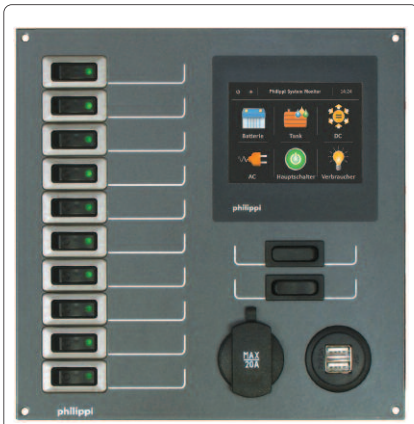
STV 250 Bestell-Nr.: 0 2002 2500

Hauptschaltern und weiteren Komponenten. Die Doppel-USB-Steckdose ist für Versorgungsspannungen von 12 V und 24 V geeignet.