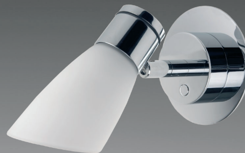
LED R1 &amp; Covering