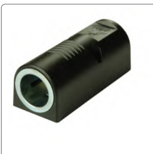
■ AZD 12/24 Bestell-Nr.: 3 6760 4000

Passende Montageplatte MP 28 Bestell.-Nr. 3 8013 5200