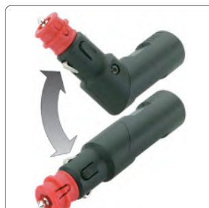
■ SWS 12/24-8A Bestell-Nr.: 3 6774 2000

Universal-Winkelstecker mit Funktionskontrolle mittels Leuchtdiode und integrierter Sicherung. Die festarretierbare Ausgleichhülse durch Bajonettverrastung gewährt einen sicheren Halt. DC 6-24 V /7,5 A, Zuleitung max. 1,5mm 2 Kabelquerschnitt.