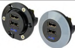
■ USD FM Bestell-Nr.: 7 0030 0240

USB Einbau-Doppel-Ladesteckdose DC 12/24 V / Ausgang USB: 5 V, 2 x 1,5 A. Einbauloch Ø 30 mm, Frontmontage. Ø 47 mm, Tiefe 23 mm, Anschluss 6,3mm Flachstecker