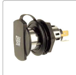
■ PSD 12/24 Bestell-Nr.: 3 5790 6100

Kupplung zur Kabelverlängerung, passend für Norm- und Universalstecker, max. 16 A/6-24 V. Anschluss mit Flachsteckern 6,3 mm.