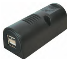
■ USD 12/24 A Bestell-Nr.: 3 6732 3000

Flache USB Aufbau-Ladesteckdose DC 12/24 V / Ausgang USB: 5 V, 3 A Abmessungen L 42 x B 34 x H 15 mm