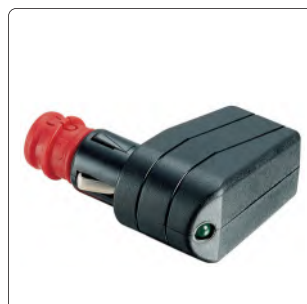
■ UWS 12/24-8A Bestell-Nr.: 3 5773 0000

Aufbausteckdose für Universalstecker, max. 16 A/ DC 6-24 V. Abmessungen L 85 x B 34 x H 33mm