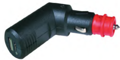
■ UWCA Bestell-Nr.: 3 6730 2600

Passende Montageplatte 60x45mm: MP 28; Bestell-Nr. 3 8013 5200