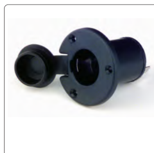
■ ESD 12V rund Bestell-Nr.: 7 0002 1216

Einbausteckdose analog zu Zigarettenanzünder mit Deckel und rechteckigem Befestigungsflansch. Erforderliches Einbauloch Ø 28 mm. Passend für Stecker Ø 21 mm. Anschluss mit Flachsteckern 6,3 mm. Strombelastbarkeit 16 A. Abmessungen L 57x B 33 x T 48mm