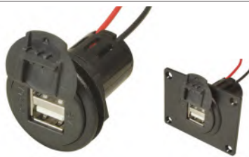
■ USD 5D Bestell-Nr.: 3 6732 1100

Passende Montageplatte 60x45mm: MP 28; Bestell-Nr. 3 8013 5200