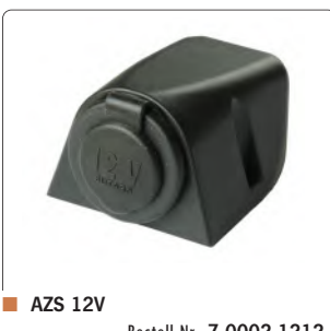
■ AZS 12V Bestell-Nr.: 7 0002 1212 ■ AZS 24V Bestell-Nr.: 7 0002 1224

Universalstecker mit Schraubanschluss und Zugentlastung. Passend für Zigarettenanzünder und Normsteckdosen. DC 6-24 V. Ausführung in 8 oder 16 A. Zuleitung bis maximal 1,5 mm 2 Kabelquerschnitt.