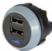
■ USD GW Bestell-Nr.: 7 0030 0250

USB Einbau-Doppel-Ladesteckdose DC 12/24 V / Ausgang USB: 5 V, 2 x 1,5 A. Einbauloch Ø 30 mm, Frontmontage. Ø 47 mm, Tiefe 23 mm, Anschluss 6,3mm Flachstecker