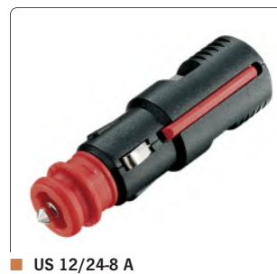
■ US 12/24-8 A Bestell-Nr.: 3 6771 1000 ■ US 12/24-16 A Bestell-Nr.: 3 6771 1010

Winkelbarer Universalstecker mit integrierter Sicherung 8 A. Die festarretierbare Ausgleichhülse durch Bajonettverrastung gewährt einen sicheren Halt. DC 6-24 V, Zuleitung max. 1,5mm 2 Kabelquerschnitt.