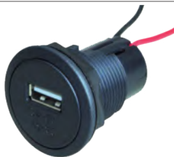
■ USB 3 Bestell-Nr.: 3 6733 1000

Winkelbare USB-Doppelsteckdose: Eingang 12/24 V, Ausgang 5 V (2 x 2,5 A). Zum Anschluss in Zigarettenanzünder- und Normsteckdosen über das 12-24 V Bordnetz.