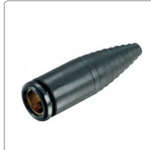
■ KP 12/24 Bestell-Nr.: 3 5762 0000

Wasserdichte Einbau-Normsteckdose mit Schraubdeckel. IP 67. Passend für Norm- und Universalstecker, max. 16 A /6-24 V. Einbauloch-Ø 18 mm, Gewindelänge 10 mm. Länge der Anschlussleitungen 30 cm. Passende Montageplatte MP 18 (B 60 x H 45 mm). Bestell.-Nr. 0 2991 0014