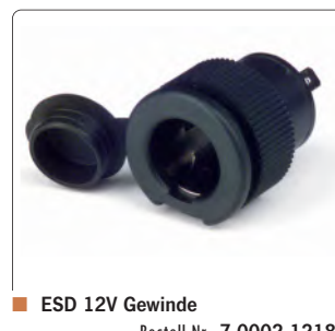
■ ESD 12V Gewinde Bestell-Nr.: 7 0002 1218 ■ ESD 24V Gewinde Bestell-Nr.: 7 0002 1824

Einbausteckdose analog zu Zigarettenanzünder mit Deckel und rundem Befestigungsflansch. Erforderliches Einbauloch Ø 28 mm. Passend für Stecker Ø 21 mm. Anschluss mit Flachsteckern 6,3 mm. Strombelastbarkeit 16 A. Abmessungen Ø 46 x T 48 mm