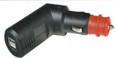
■ UWB Bestell-Nr.: 3 6730 2100

USB Einbau-Doppel-Ladesteckdose DC 12/24 V / Ausgang USB: 5 V, 2 x 1,5 A. Einbauloch Ø 30 mm, Befestigung mittels Sechskant-Kontermutter. Durchmesser Ø 37 mm, Tiefe 23 mm