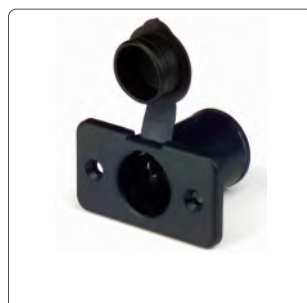
■ ESD 12 V eckig Bestell-Nr.: 7 0002 1206

Aufbausteckdose mit Deckel für Zigarettenanzünderstecker und formschönem Befestigungsflansch. Passend für Stecker Ø 21 mm. Anschluss mit Flachsteckern 6,3 mm. Strombelastbarkeit 16 A. Bohrlochabstand 44 mm. Abmessungen L 81 x B 55 x H 41 mm