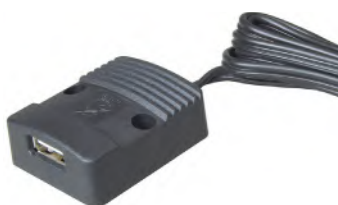
■ USF 3A Bestell-Nr.: 3 6733 9000

Winkelbare USB-C/A Doppelsteckdose mit blauer LED, Ausgang 5 V (max. 3,6 A). Zum Einstecken in Zigarettenanzünder- und Normsteckdosen über das 12-24 V Bordnetz.