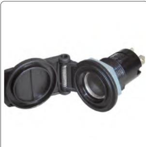
■ ESD 12/24 Bestell-Nr.: 3 6760 7100

Einbau-Normsteckdose mit Klappdeckel. Passend für Norm- und Universalstecker, max. 16 A/6-24 V. Einbauloch-Ø 18 mm, Gewindelänge 8 mm. Anschluss mit Flachsteckern 6,3 mm. Passende Montageplatte MP 18 (B 60 x H 45 mm). Bestell.-Nr. 0 2991 0014