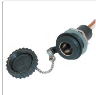
■ WSD 12/24 Bestell-Nr.: 3 5200 5000

Einbau-Normsteckdose mit Klappdeckel. Passend für Norm- und Universalstecker, max. 16 A/6-24 V. Einbauloch-Ø 18 mm, Gewindelänge 8 mm. Anschluss mit Flachsteckern 6,3 mm. Passende Montageplatte MP 18 (B 60 x H 45 mm). Bestell.-Nr. 0 2991 0014